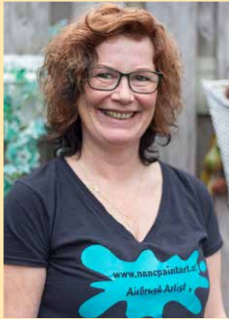
Airbrush: fotografieren met verf