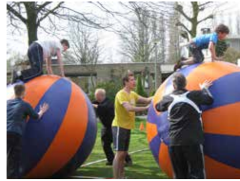
De zeskamp, een van de georganiseerde activiteiten van de buurtvereniging

Verder zijn er mensen in de weer voor specifieke zaken als pr, het bijhouden van de verjaardagen