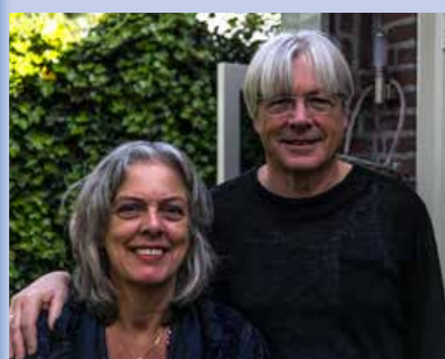
Hoe zit het met het energiegebruik van de inwoners in Boxtel Oost? En hun visie op duurzaamheid?