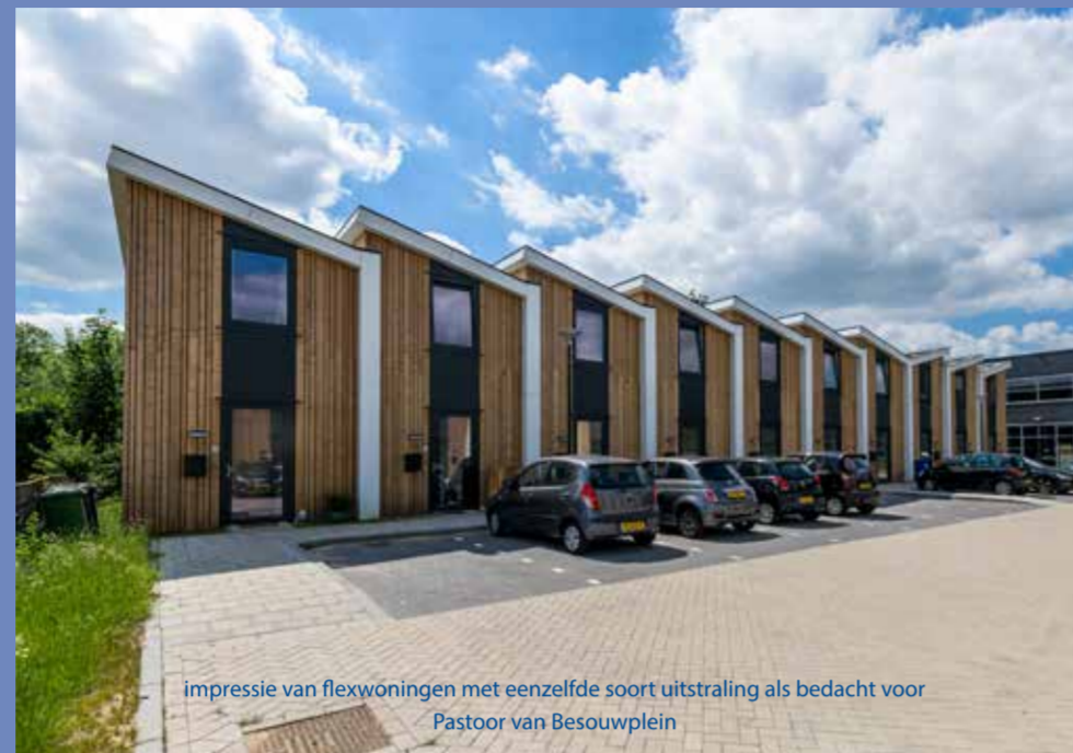
Impressie van flexwoningen met eenzelfde soort uitstraling als bedacht voor Pastoor van Besouwplein

De gemeente Boxtel en Woonstichting JOOST hebben samen het plan om op een deel van het grasveld aan het Pastoor van Besouwplein – grenzend aan het parkeerterrein van Hoogheemflat 1 – twaalf zogenaamde flexwoningen te plaatsen. Waarom flexwoningen? Een van de oplossingen om de druk op de woningmarkt te verminderen, is de bouw van flexwoningen.