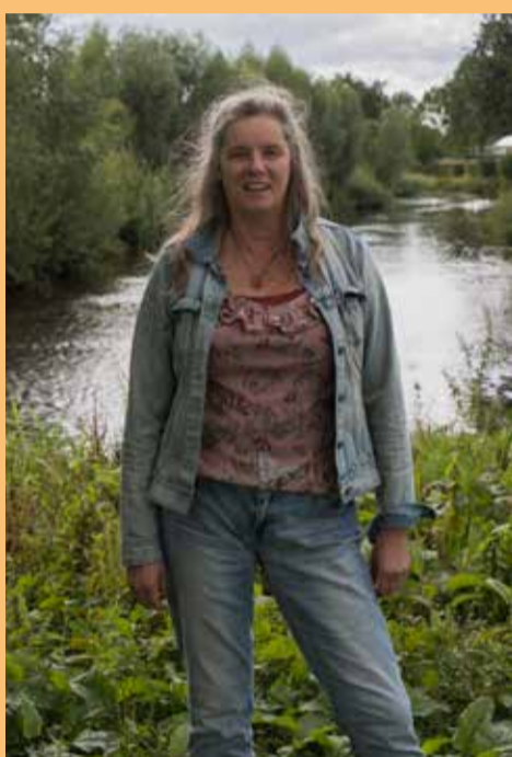
meerdere behandelingen ervaren ze meer stabiliteit, echtheid en zelfvertrouwen."

Na één sessie voelen mensen zich vaak al prettiger, meer gegrond en levendiger. "En na